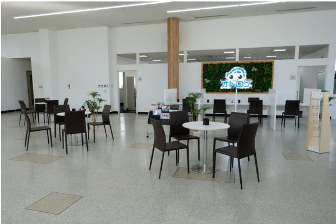
オトロン盛岡店（内観）