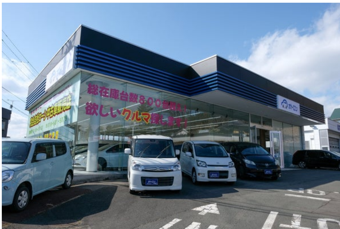
オトロン盛岡店（外観）

世の中には車を必要としていても、過去の信用情報に関わる失敗が大きなハードルとなり自動車ローンを組めない方が多く、再起したくても再起できない現実があります。オトロンは自社ローンを活用することで、前を向いて歩もうとする方へ寄り添い、未来を見据えて最適な自動車を提供し、皆様とともに何度でも挑戦できる社会をつくってまいります。